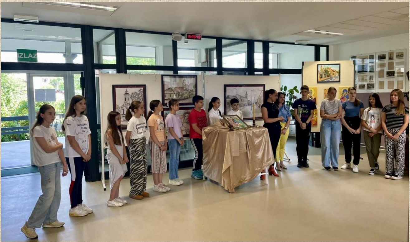
13. јун 2025. Завршетак школске 2024/2025. године и растанак од учитељица одељења 4/1, 4/2 и 4/3. Традиционални, генерацијски излет и боравак у порти цркве Светог Николе у Брусници.