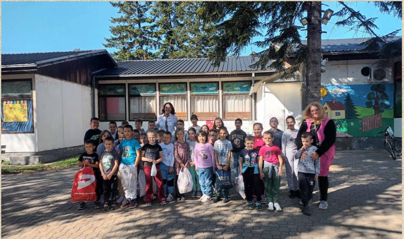
20. октобар 2024. Ученици 3. разреда обележили су Дан здраве хране, 16. октобар, као и Дан јабука, 20. октобар.